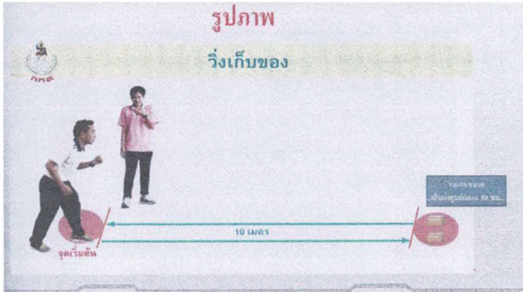
ภาพประกอบการวิ่งเก็บของ